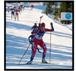
Forutsetning for prestasjon