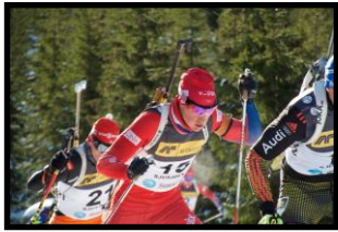
Trent for å trene