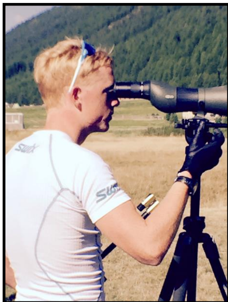
Video / Bilde